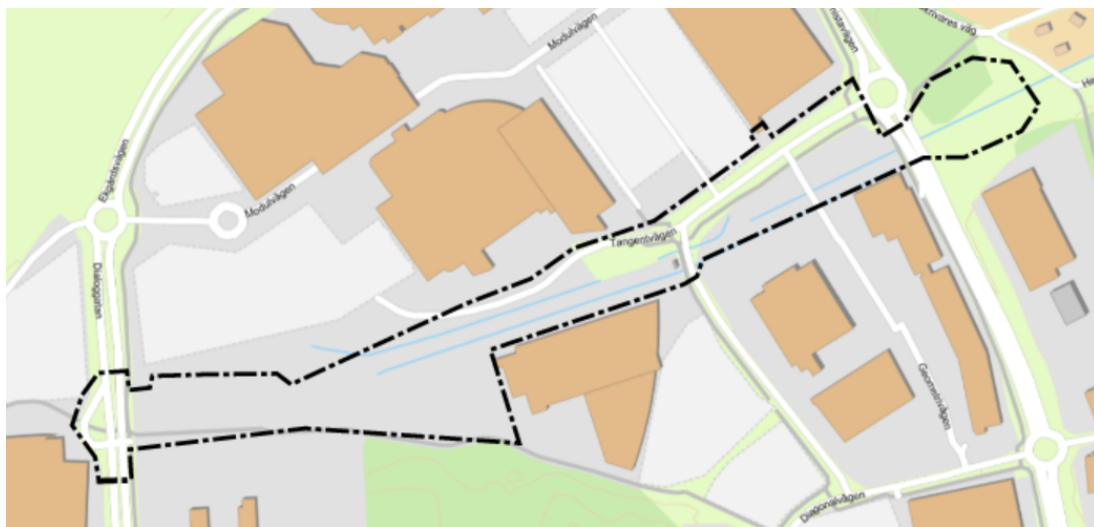
Bild 1. Projektområde Ingvar Kamprads Allé

Inom den regionala stadskärnan Kungens Kurva planeras en ny huvudgata, Ingvar Kamprads Allé, i förlängningen av nuvarande Tangentvägen ner till Dialoggatan. Gatan är utpekad som stamnät för kollektivtrafik och utformas som huvudstråk för buss med mittförlagda kollektivkörfält, nya busshållplatslägen samt gång- och cykelbanor för att förbättra de östvästliga kopplingarna i området för samtliga trafikslag. Den nya gatan är en del av den övergripande utvecklingen av stadskärnan och en förutsättning för bland annat den planerade utbygganden av IKEA samt den planerade exploateringen i kvarter Diametern med cirka 3500 bostäder. I projektet planerar även Stockholm Vatten och Avfall (SVOA) att anlägga nya dagvattendammar samt vatten- och avloppsledningar söder om vägen för att öka ledningskapaciteten i området samt att öka kapaciteten vid skyfall och minska risken för översvämningar. I projektet ingår även ett torg, Gustav V:s torg vid Dialoggatan. I den västra delen planeras även ett stationsläge för framtida Spårväg syd.